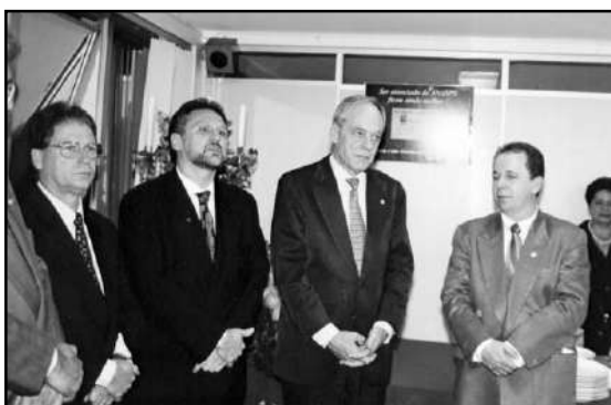
da esquerda para a direita, 2º, Ministro do MPS, Sergio Cutolo dos Santos, de 15/12/93 a 1º/01/95