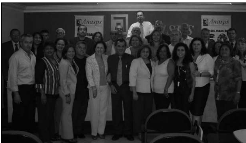
Reunião do Conselho Diretor da ANASPS em Brasília, novembro 2006