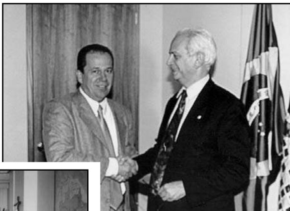
à direita, Presidente do INSS, Francisco Fontana, de 22/03/01 a 14/03/02