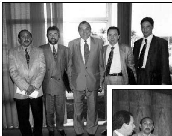
da esquerda para a direita, 3º, Deputado Inocêncio de Oliveira