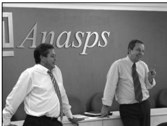
Reunião na ANASPS, 27/11/2007