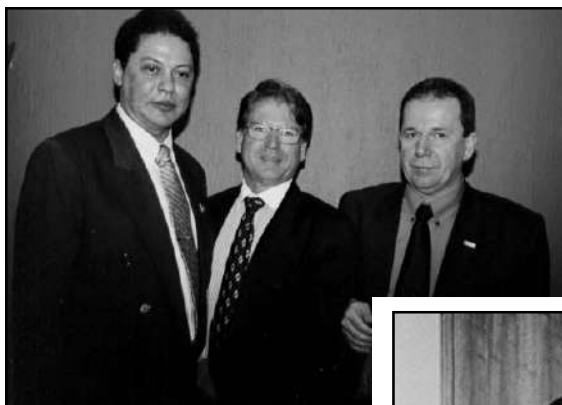
ao centro, Presidente do INSS, Crésio de Matos Rolim, de 30/03/95 a 15/03/01