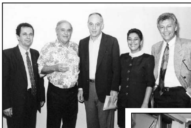
da esquerda para a direita, 3º, Ministro do MPS, Reinhold Stephanes, de 1º/01/95 a 03/04/98