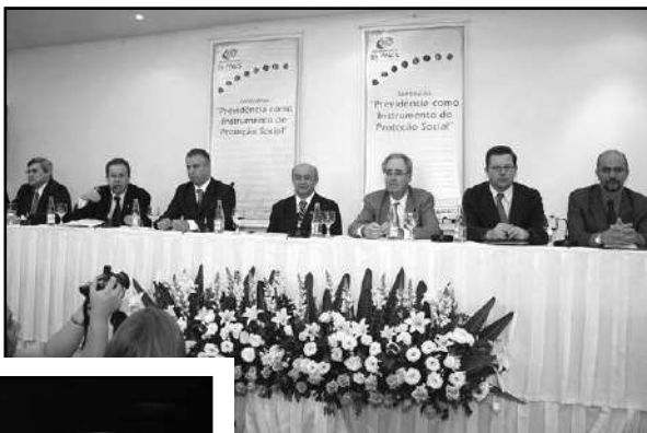
Seminário “Previdência como instrumento de Proteção Social”, em Belo Horizonte/MG