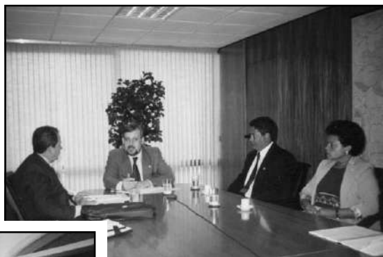
na cabeceira da mesa, Ministro do MPS, Ricardo Berzoini, de 1º/01/03 a 23/01/04