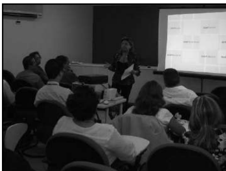
Reunião do Conselho Diretor da ANASPS em Brasília, abril de 2007