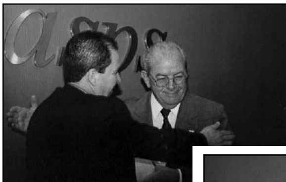
à direita, Ministro do MPS, Jarbas Passarinho, de 11/11/83 a 14/03/85