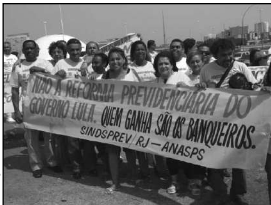
Manifestação – ANASPS e Sindsprev/RJ – no Ministério da Previdência Social em defesa do servidor público e da Previdência Social