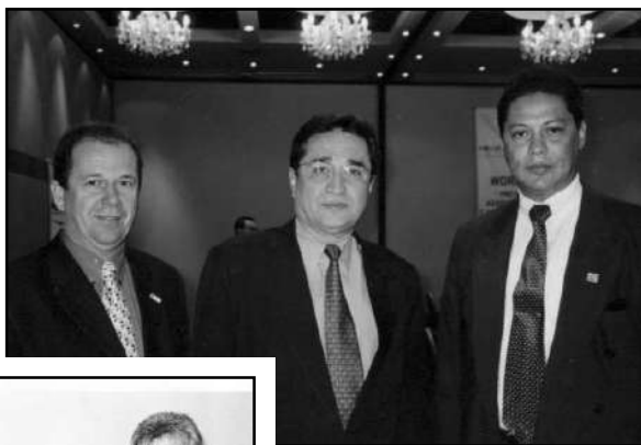
ao centro, Ministro do MPS, Waldeck Ornelas, de 07/04/98 a 24/02/01