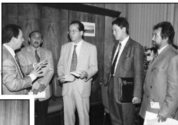
da esquerda para a direita, 3º, Deputado José Aníbal