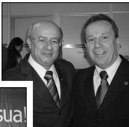
à esquerda, Ministro do MPS, a partir de 11/06/2008, José Pimentel