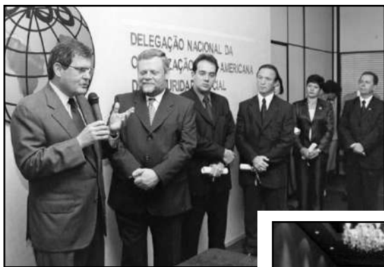
da esquerda para a direita, Ministro do MPS, Roberto Brant, de 12/03/01 a 08/03/02