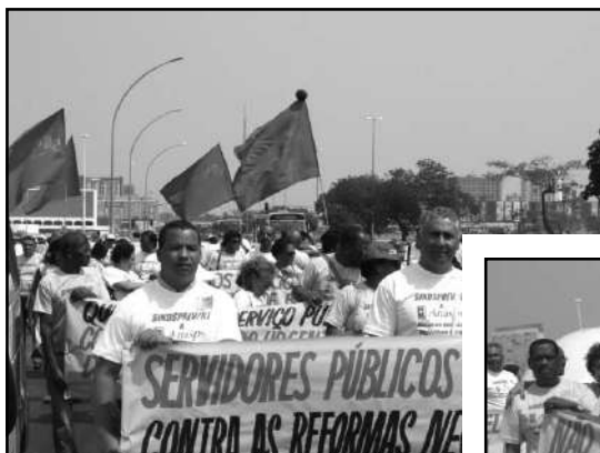
Manifestação contra a 3ª reforma da Previdência, em 19/09/07