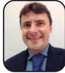
Marlus Eduardo Losso 2

RESUMO: Este artigo tem como objetivo comparar as políticas públicas voltadas para a inclusão das pessoas com deficiência no mercado de trabalho, considerando os ordenamentos jurídicos brasileiro e italiano. A pesquisa foca na análise das mudanças legislativas sobre o tema, com especial atenção às leis de cotas obrigatórias, que existem nos dois países. O estudo comparativo considera a influência histórica que o sistema jurídico italiano teve e ainda exerce sobre o direito do trabalho brasileiro. Os resultados revelam que ambos os países buscam proteger esse grupo, frequentemente marginalizado, destacando aspectos positivos da legislação italiana. Além de oferecer incentivos econômicos para a contratação de pessoas com deficiência, a Itália implementa uma política de cotas mais adequada à sua realidade, que reserva vagas em empresas com 15 ou mais funcionários.