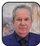
Por Paulo César Régis de Souza