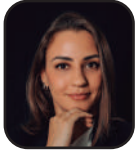
Camilla Martins dos Santos Benevides 1

RESUMO: Este artigo tem como objetivo comparar as políticas públicas voltadas para a inclusão das pessoas com deficiência no mercado de trabalho, considerando os ordenamentos jurídicos brasileiro e italiano. A pesquisa foca na análise das mudanças legislativas sobre o tema, com especial atenção às leis de cotas obrigatórias, que existem nos dois países. O estudo comparativo considera a influência histórica que o sistema jurídico italiano teve e ainda exerce sobre o direito do trabalho brasileiro. Os resultados revelam que ambos os países buscam proteger esse grupo, frequentemente marginalizado, destacando aspectos positivos da legislação italiana. Além de oferecer incentivos econômicos para a contratação de pessoas com deficiência, a Itália implementa uma política de cotas mais adequada à sua realidade, que reserva vagas em empresas com 15 ou mais funcionários.