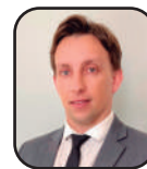
Por Tiago Adami Siqueira

A decisão do STF na ADI 2135, ao declarar o fim do regime jurídico único e do vínculo estatutário para servidores da administração direta, autarquias e fundações públicas representa um verdadeiro ataque à essência do serviço público no Brasil. Esse julgamento impõe uma quebra radical no modelo de carreiras públicas, que sempre buscou a estabilidade como característica indispensável para assegurar a prestação de serviços públicos de qualidade e com independência.